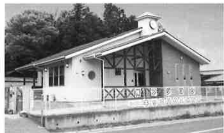
少人数制 キッズハウス保育園