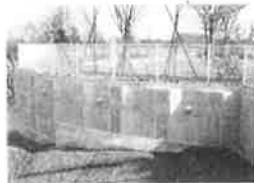
親杭パネル壁工法