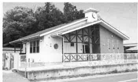
少人数制 キッズハウス保育園