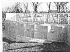
親抗パネル壁工法