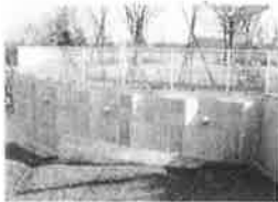
銀杭パネル壁工法