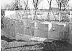
親抗パネル壁工法