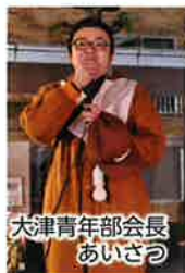
大津青年部会長 あいさつ