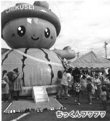
ちっくんフワフワ

5年ぶりの2日間開催となった今回の商工まつりは、70を超える出店者による「筑西市最大の物産展示会」や、プロバスケットチームを招いての3X3バスケットボール大会、昨年大好評だったこどもフリマなどが行われました。また、ステージイベントでは、吉本芸人のお笑いライブ、下館工業高校ジャズバンド部の演奏、ピンゴ大会や大抽選会等が会場を大いに盛り上げました。ご協力いただきました関係者の皆様、誠にありがとうございました。