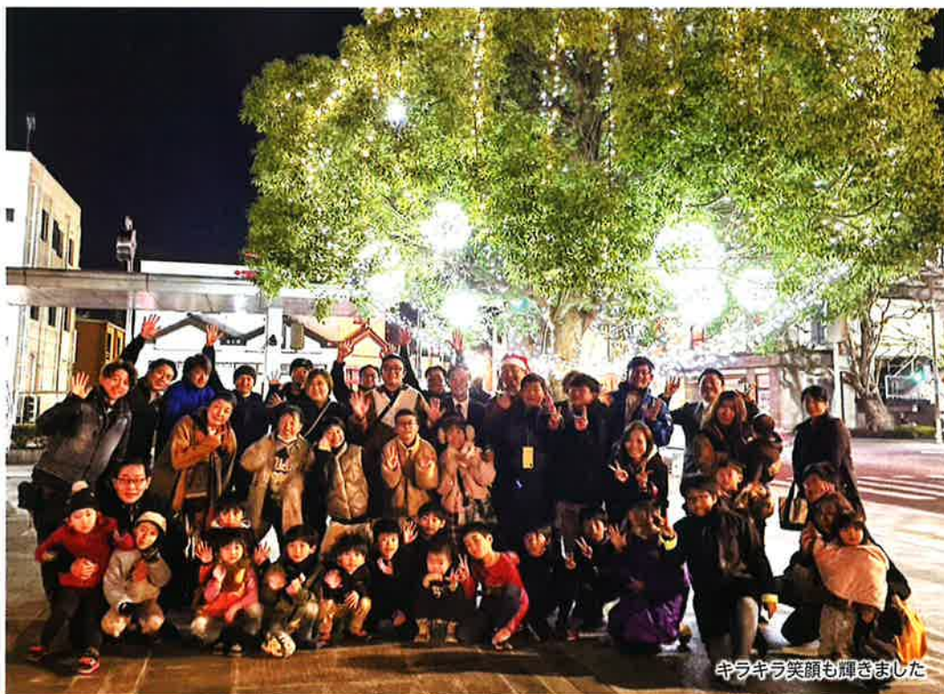
キラキラ笑顔も輝きました

当所青年部は、12月1日、下館税務署前広場でイルミネーション点灯式を開催しました。