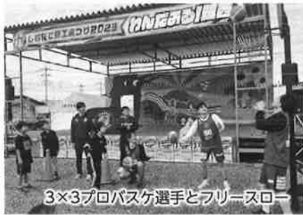
3×3プロバスケット選手とフリースロー