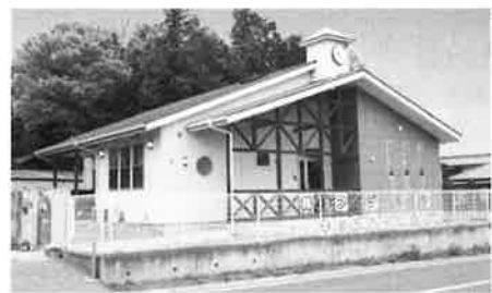
少人数制 キッズハウス保育園