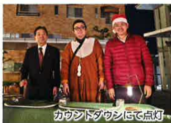
カウントダウンにて点灯