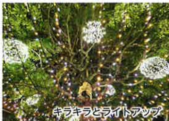
キラキラとライトアップ