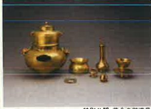
特別公開 黄金の茶道具