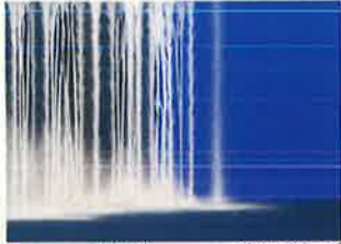
ウォーターフォール・オン・カラス