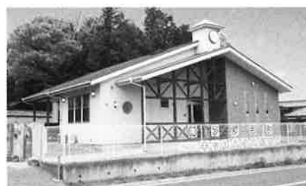
少人数制 キッズハウス保育園