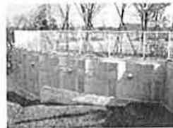
親抗パネル壁工法